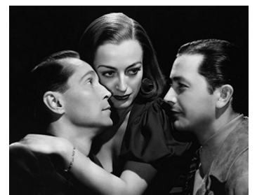
1937 L'INCONNUE DU PALACE (The Bride wore red) de D. Arzner avec F. Tone, Robert Young