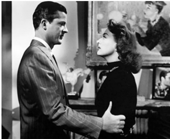
1947 FEMME OU MAÎTRESSE (Daisy Kenyon) d'Otto Preminger avec Dana Andrews