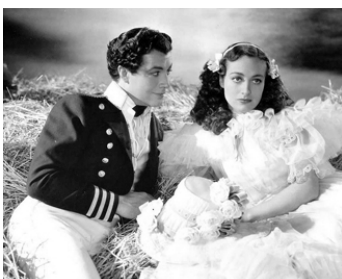
1936 L'ENCHANTRESSE (The gorgeous Hussy) de Clarence Brown avec Robert Taylor