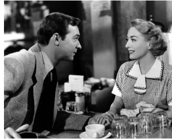
1948 BOULEVARD DES PASSIONS (Flamingo Road) de Michael Curtiz avec Zachary Scott