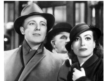
1934 VIVRE ET AIMER (Sadie McKee) de Clarence Brown avec Gene Raymond