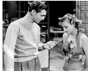
1933 LE TOURBILLON DE LA DANSE (Dancing Lady) de Robert Z. Leonard avec Clark Gable