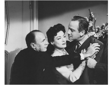
1942 EMBRASSONS LA MARIÉE (They all kissed the Bride) d'A. Hall avec Roland Young, M. Douglas