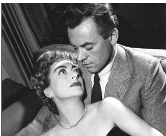
1955 UNE FEMME DIABOLIQUE (Queen Bee) de Ronald McDougall avec Barry Sullivan