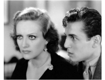
1930 LA PENTE (Dance, fools, dance) d'Harry Beaumont avec William Bakewell