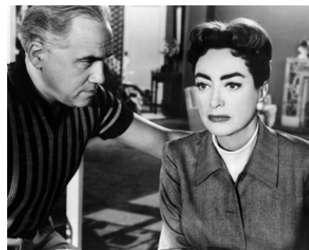
1956 FEUILLES D'AUTOMNE (Autumn Leaves) de Robert Aldrich avec Lorne Greene