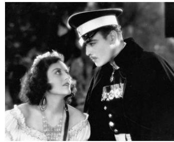
1928 CŒUR DE TZIGANE (Dream of Love) de Fred Niblo avec Nils Asther