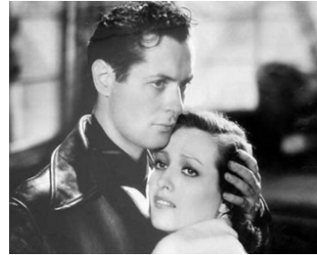
1930 CŒURS IMPATIENS (Our blushing Brides) d'Harry Beaumont avec Robert Montgomery