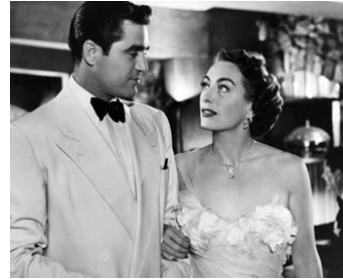
1950 L'ESCLAVE DU GANG (The Damned don't cry) de Vincent Sherman avec Steve Cochran