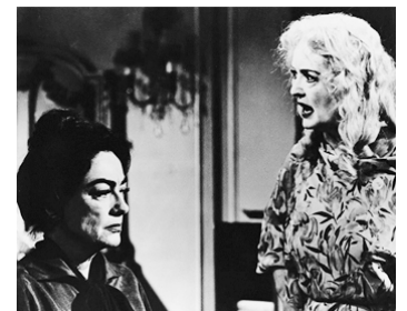
1962 QU'EST-IL ARRIVÉ À BABY JANE (What ever happened...) de R. Aldrich avec Bette Davis