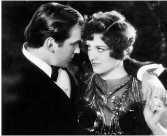
1929 ARDENNE JEUNESSE (Our modern Maidens) de Jack Conway avec Douglas Fairbanks Jr