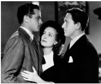
1937 MANNEQUIN (Mannequin) de Frank Borzage avec Alan Curtis, Spencer Tracy