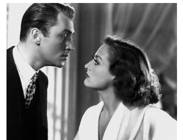
1935 VIVRE SA VIE (I live my Life) de W. S. Van Dyke avec Brian Aherne