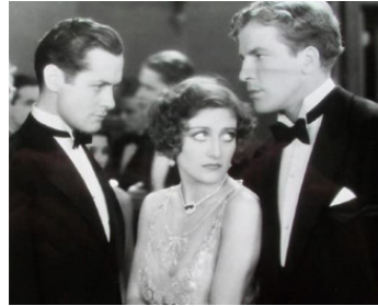
1929 INDOMPTÉE (Untamed) de Jack Conway avec Robert Montgomery, Don Terry