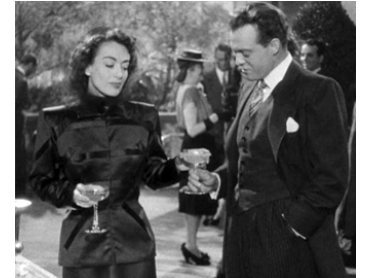
1947 LA POSSÉDÉE (Possessed) de Curtis Bernhardt avec Van Heflin