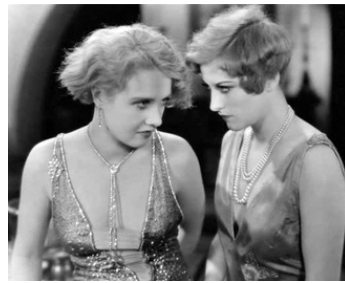
1928 LES NOUVELLES VIERGES (Our dancing Daughters) d'H. Beaumont avec Anita Page