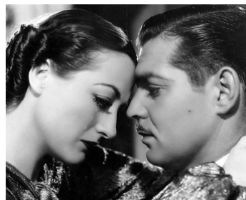
1934 LA PASSAGÈRE (Chained) de Clarence Brown avec Clark Gable