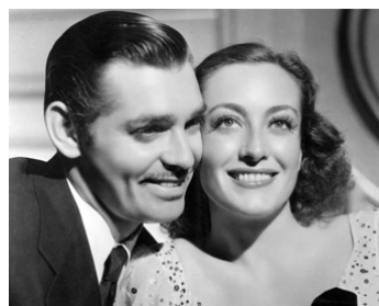
1936 LOUFOQUE ET COMPAGNIE (Love and the run) de W. S. Van Dyke avec Clark Gable