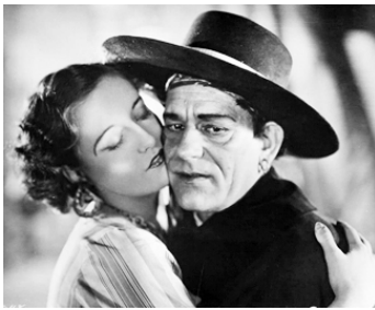
1927 L'INCONNU (The Unknown) de Tod Browning avec Lon Chaney Sr