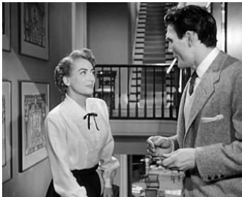
1952 LE MASQUE ARRACHÉ (Sudden Fear) de David Miller avec Jack Palance