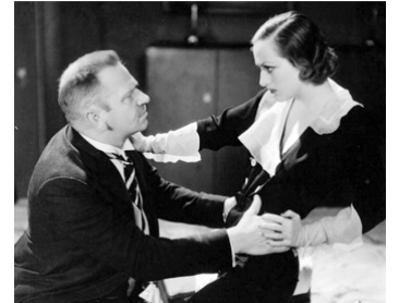
1932 GRAND HÔTEL (Grand Hotel) d'Edmund Goulding avec Wallace Beery