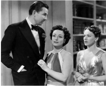
1940 SUZANNE ET SES IDÉES (Susan and God) de G. Cukor avec Bruce Cabot, Rose Hobart