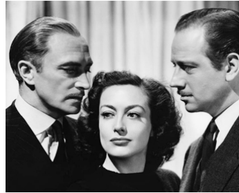
1941 IL ÉTAIT UNE FOIS (A Woman's Face) de G. Cukor avec Conrad Veidt, M. Douglas