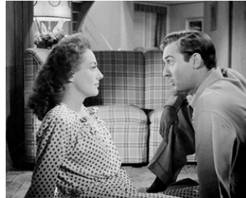
1945 LE ROMAN DE MILDRED PIERCE (Mildred Pierce) de Michael Curtiz avec Zachary Scott