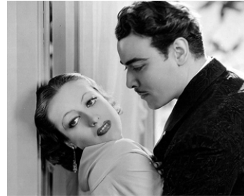
1932 CAPTIVE (Letty Lynton) de Clarence Brown avec Nils Asther