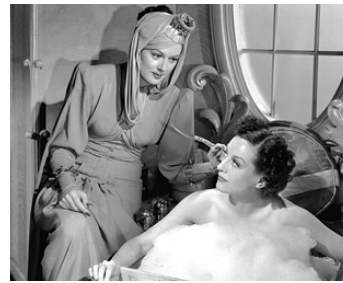
1939 FEMMES (The Women) de George Cukor avec Rosalind Russell