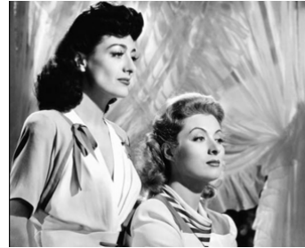
1941 DUEL DE FEMMES (When Ladies meet) de Robert Z. Leonard avec Greer Garson