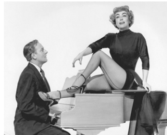
1953 LA MADONE GITANE (Torch Song) de Charles Walters avec Michael Wilding