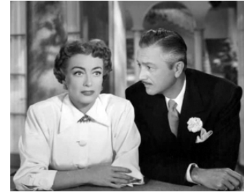
1951 LA FLAMME DU PASSÉ (Goodbye, my Fancy) de Vincent Sherman avec Robert Young