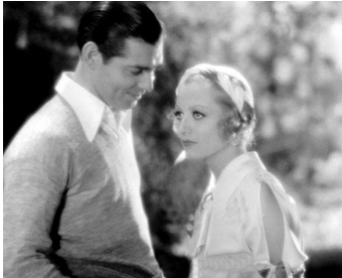
1931 LA PÉCHERESSE (Laughing Sinners) d'Harry Beaumont avec Clark Gable