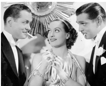
1934 SOUVENT FEMME VARIE (Forsaking all others) de W. S. Van Dyke avec R. Montgomery, C. Gable