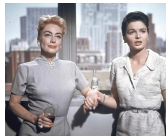
1959 RIEN N'EST TROP BEAU (The best of everything) de J. Negulesco avec Linda Hutchings