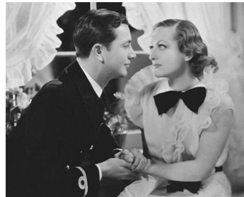
1933 APRÈS NOUS LE DÉLUGE (Today we live) d'H. Hawks & R. Rosson avec Robert Young