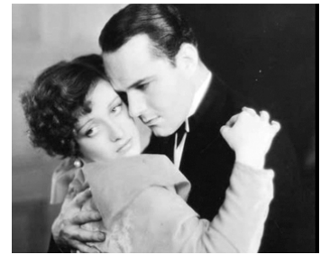
1929 LA TOURNÉE DU GRAND DUKE (The Duke steps out) de James Cruze avec William Haines