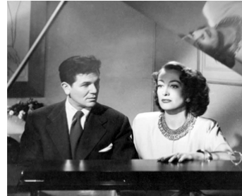
1946 HUMORESQUE (Humoresque) de Jean Negulesco avec John Garfield