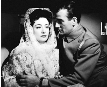
1942 QUELQUE PART EN FRANCE (Reunion in France) de Jules Dassin avec John Wayne