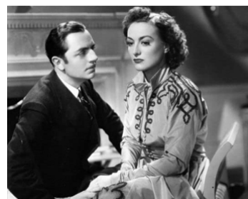
1936 LA FIN DE MADAME CHEYNEY (The Last of Mrs Cheyney) de R. Boleslawski avec W. Powell