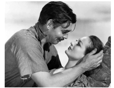
1939 LE CARGO MAUDIT (Strange Cargo) de Frank Borzage avec Clark Gable