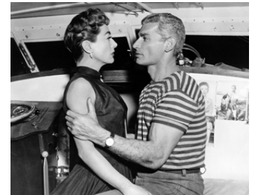
1955 LA MAISON SUR LA PLAGES (Female on the Beach) de Joseph Pevney avec Jeff Chandler