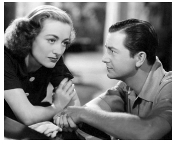
1938 L'ENSORCELEUSE (The shining Hour) de Frank Borzage avec Robert Young