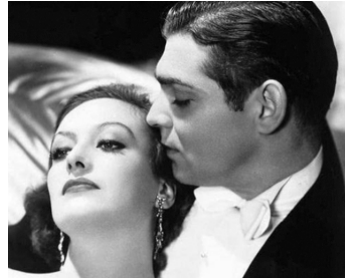
1931 FASCINATION (Possessed) de Clarence Brown avec Clark Gable