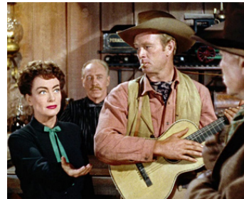
1954 JOHNNY GUITAR de Nicholas Ray avec Sterling Hayden, Ward Bond